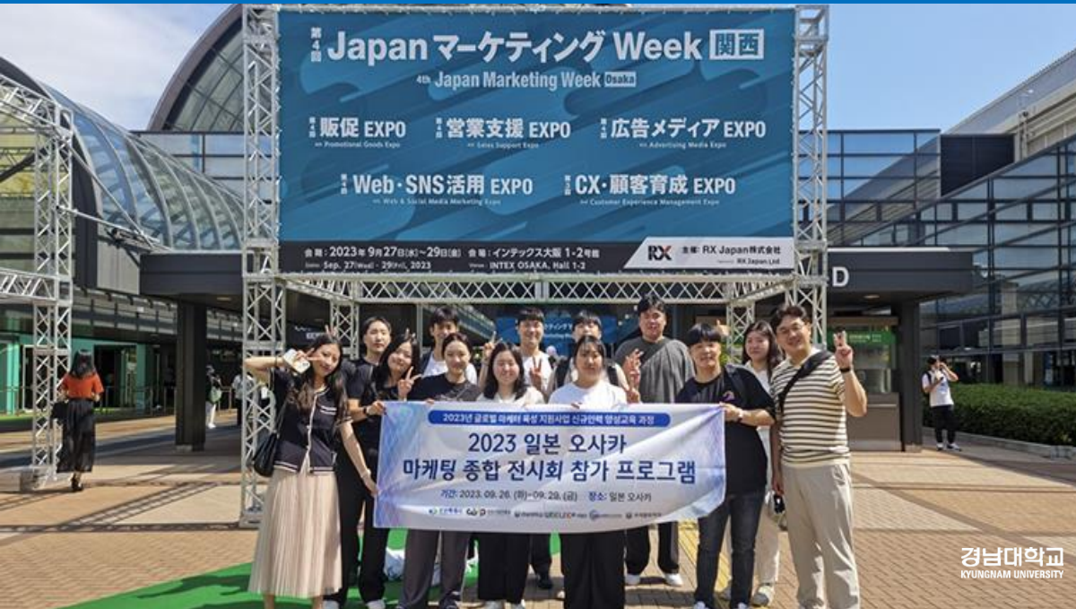
사진 클릭 링크 이동