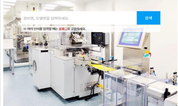
사진 클릭 링크 이동

경남테크노파크에서는 지역경제 발전과 산업구조의 고도화를 목표로 경상남도 내 소재한 기업, 연구소 및 관련기관에 장비활용을 지원합니다.